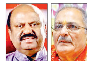
तमिलनाडु के राज्यपाल रवि को पश्चिम बंगाल की अतिरिक्त जिम्मेदारी

कोलकाता/लेह। पश्चिम बंगाल चुनाव से एक महीने पहले राज्यपाल सीवी आनंद बोस ने इस्तीफा दे दिया है। तमिलनाडु के राज्यपाल आरएन रवि को बंगाल की भी अतिरिक्त जिम्मेदारी दी गई है। उधर, लदाख के उपराज्यपाल कबींद्र गुप्ता ने भी इस्तीफा दे दिया है। बोस ने राष्ट्रपति द्रोपदी मुर्मू को अपना इस्तीफा भेज दिया है। फिलहाल वे दिल्ली में मौजूद हैं। उधर, मुख्यमंत्री ममता बनर्जी ने बोस के इस्तीफे पर हैरानी जताई। उन्होंने बताया कि केंद्रीय गृहमंत्री ने अभी मुझे सूचित किया है कि आरएन रवि को पश्चिम बंगाल का राज्यपाल