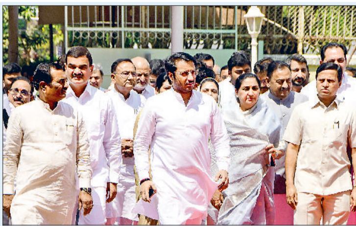
मुंबई। एनसीपी नेता पार्थ पवार महाराष्ट्र की डिप्टी सीएम और मां सुनेत्रा पवार के साथ राज्यसभा चुनाव के लिए अपना नामांकन दाखिल करने के लिए मुंबई में एक कार्यक्रम में शामिल हुए।

सुनेत्रा पवार वर्तमान में महाराष्ट्र की उपमुख्यमंत्री और राकोंपा अध्यक्ष भी हैं, जबकि शरद पवार की बेटी और राकोंपा (शप) की कार्यकारी अध्यक्ष सुप्रिया सुले परिवार के गृह क्षेत्र बरामती से लोकसभा सदस्य हैं। पार्थ के पिता एवं शरद पवार के भतीजे अजित पवार की 28 जनवरी को बरामती में एक विमान दुर्घटना में मृत्यु हो गई थी। शरद पवार चार बार महाराष्ट्र के मुख्यमंत्री रह चुके हैं और केंद्र में रक्षा मंत्री और कृषि मंत्री भी रह चुके हैं। वह आगामी राज्यसभा चुनाव के लिए विपक्षी महा विकास आघाडी (एमवीए) के उम्मीदवार के रूप में मैदान में उतरे हैं।