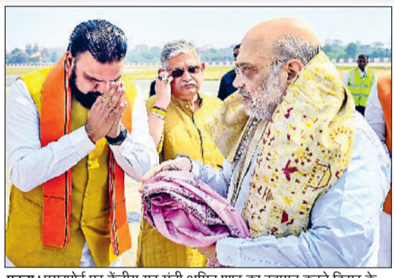
पटना। एयरपोर्ट पर केंद्रीय गृह मंत्री अमित शाह का स्वागत करते बिहार के उप मुख्यमंत्री सम्राट चौधरी।

विजय चौधरी भी दावेदार, संघ का चेहरा भी ला सकती है भाजपा, नीतीश अपने हनुमान विजय चौधरी पर जता सकते हैं मरोसा