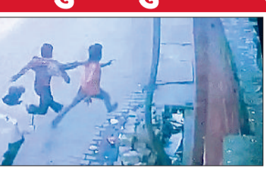
सीसीटीवी में कैद हमला करते आरोपी युवक।

पानीपत। पानीपत शहर में होली खेल रहे युवकों के बीच झगड़ा हो गया। इस झगड़े में एक युवक की पीट-पीटकर हत्या कर दी गई। विवाद दो बाइकों के टकराने को लेकर शुरू हुआ था। एक बार मामला शांत करा दिया गया, लेकिन कुछ देर बाद ही कई युवक इकट्ठा होकर आए और फिर झगड़ा करने लगे। इसी बीच हमलावरों ने एक युवक को दूसरे गुट का समझकर धर लिया। पहले उसकी पिटाई की गई, फिर ईंटों से वार करके हत्या कर दी गई। इसके बाद हमलावर वहां से फरार हो गए। आसपास के लोगों ने खून से लथपथ युवक को उठाकर एक निजी