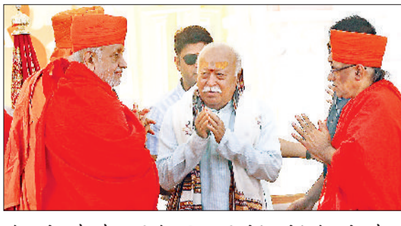
उद्देश्य होता है और सभी के प्रति अपनेपन की भावना सामाजिक सद्भाव का सार है। उन्होंने कहा, ईश्वर की सृष्टि में सूखी घास के तिनके का भी कोई न कोई उद्देश्य होता है। सभी को इसी भाव से अपनाया और हृदय में अपनेपन की भावना रखना ही सामाजिक समरसता कहलाता है।

जाति के नाम पर भेदभाव धर्म और समाज दोनों को पहुंचाता है नुकसान भाषा अहमदाबाद राष्ट्रीय स्वयंसेवक संघ (आरएसएस) के प्रमुख मोहन भागवत ने बृहस्पतिवार को कहा कि सनातन धर्म सामाजिक सद्भाव और एकता को बढ़ावा देता है। उन्होंने साथ ही कहा कि जाति के नाम पर भेदभाव किया जाना धर्म और समाज दोनों को नुकसान पहुंचाता है। भागवत ने यहां के निकट जेतलपुर गांव में स्वामीनारायण मंदिर में एक समारोह को संबोधित करते हुए कहा कि भगवान की प्रत्येक रचना का एक उद्देश्य होता है और सभी के प्रति अपनेपन की भावना सामाजिक सद्भाव का सार है। उन्होंने कहा, ईश्वर की सृष्टि में सूखी घास के तिनके का भी कोई न कोई उद्देश्य होता है। सभी को इसी भाव से अपनाया और हृदय में अपनेपन की भावना रखना ही सामाजिक समरसता कहलाता है।