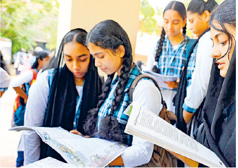
तिरुवनंतपुरम। केरल में 10 की परीक्षा देने से पहले बच्चे एक परीक्षा केंद्र पर गुरुवार को रिवीजन करते हुए।