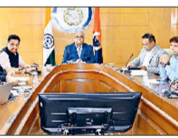
डीजीपी की अध्यक्षता में स्टेट एम्पावर्ड कमिटी की बैठक